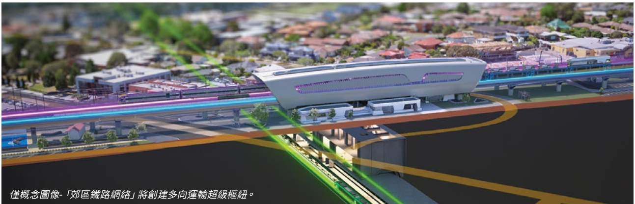
僅概念圖像-「郊區鐵路網絡」將創建多向運輸超級樞紐。

有關工程的最新更新，請點擊我們網站上的視頻鏈接 — suburbanrailloop.vic.gov.au